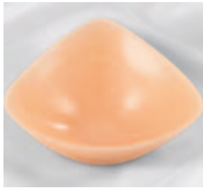
Amoena Balance Contact

Les compléments Amoena Balance sont proposés en deux épaisseurs en fonction du volume de tissus prélevés.