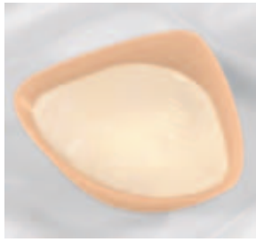
Amoena Balance Individual

Adhère directement sur le sein grâce à une bande Contact sur le pourtour et reste parfaitement en place tout en assurant une transition parfaitement naturelle avec le corps. Pour son utilisatrice, c'est plus de liberté, de sécurité et de confiance en soi.